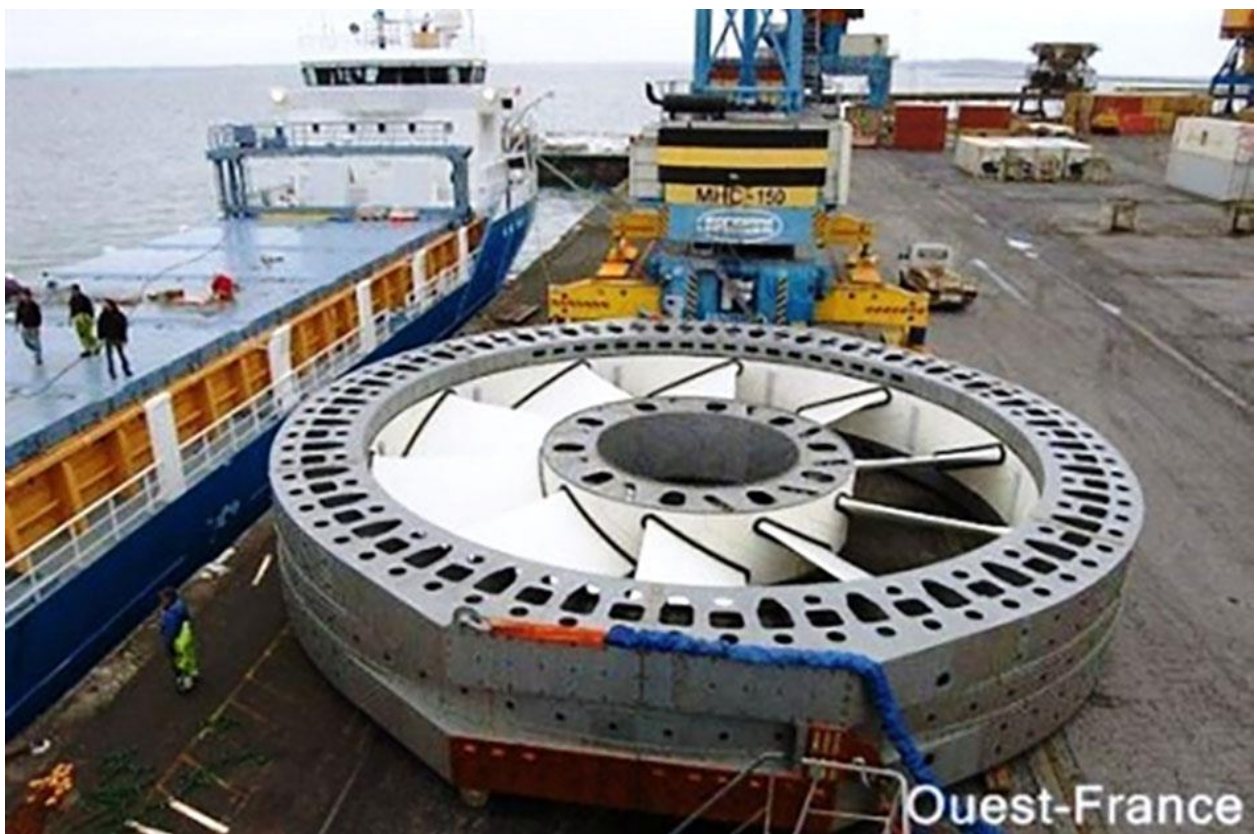
Le rotor de l'hydrolienne et son trou central

Ce projet de 40 millions d'euros sera financé par EDF et, on peut l'espérer, pas uniquement dans l'espoir de remporter le marché d'une centrale à gaz de 450 MW une centaine de fois plus puissante en baie de Brest. Les pièces maîtresses de l'hydrolienne, sous-traitées à la firme irlandaise Open Hydro, ont été assemblées à Brest. Le projet a été mené en concertation avec les pêcheurs de crustacés et les ostréiculteurs locaux « en douceur ». Dans un premier temps, le prix du kWh développé par cet engin innovant sera inévitablement plus élevé que l'éolien terrestre (environ 10 fois plus selon le journal « Ouest-France »). Il devrait ensuite baisser rapidement si le traitement antifouling des pales s'avère efficace et ne nécessite pas un ragréage trop fréquent.