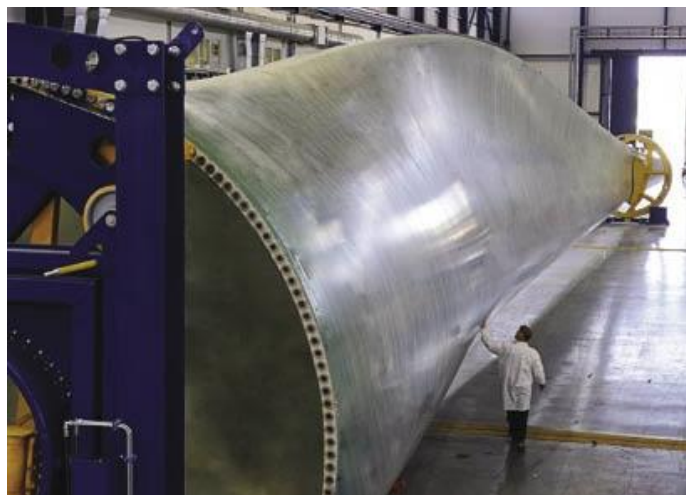
La figure ci-dessus représentant une des 3 pales constituant le rotor d'une des plus grosses éoliennes au monde construite par les Danois (La Vestas V164 de 7 000 kW). La longueur de cette pale (80 m) donne une idée du gigantisme de ce genre de réalisation.

Une éolienne ayant une puissance nominale de 1 000 kW qui produit 1 000 kilowattheures en une heure atteint cette performance maximale par vents forts supérieurs à quelque 15 m/s. Contrairement aux capteurs solaires voltaïques, qui délivrent du courant continu et qui nécessitent un onduleur, les éoliennes produisent directement du courant alternatif. La régulation de ces grosses machines est complexe. Il est vraisemblable que l'on fait varier l'incidence des pales lorsque la vitesse du vent change pour faire tourner les pales à vitesse constante afin de respecter la fréquence du réseau de 50 Hz (60 Hz aux États-Unis).