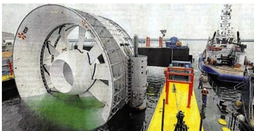
Avant immersion à Paimpol